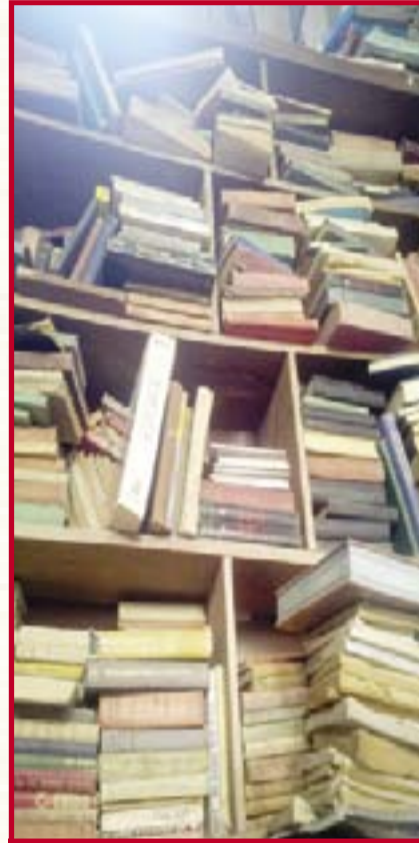
شوشرة - سلسبيل الصبح