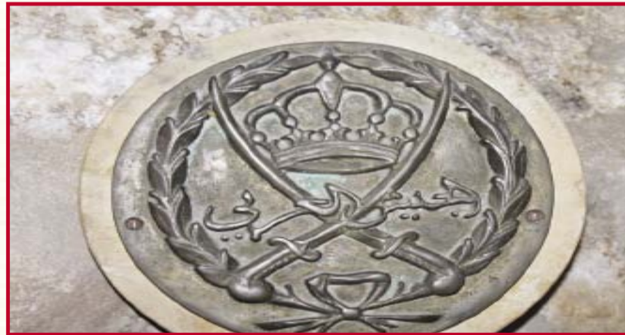
عزوة - عبدالرحمن الزغول