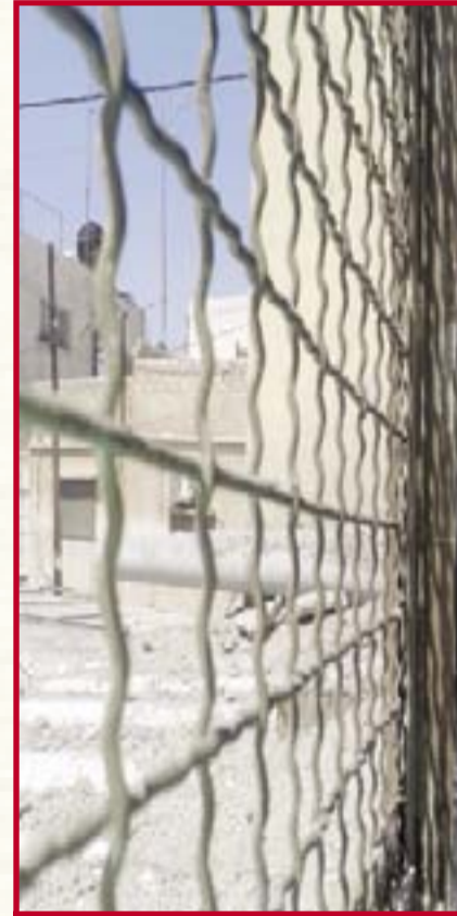
ريماز شاتي - لتسييح منازلكم