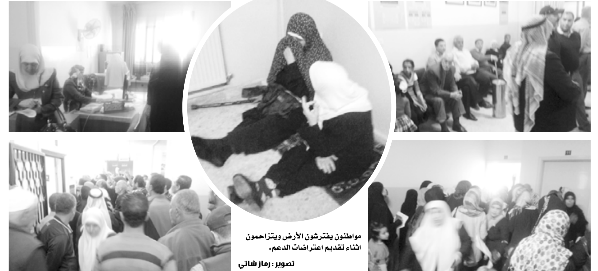
مواطنون يفترضون الأرض ويتزاحمون اثناء تقديم اعتراضات الدعم»

وتتيح الدائرة لمن لم يتقدم بطلب الحصول على دعم للمحروقات خلال فترة الاعتراض، تقديم طلبات جديدة لمن كانت تواجههم ظروف خاصة بسبب وجودهم في المستشفى او نزلاء مراكز الاصلاح والسجون مع الوثائق التي تدعم ذلك من الجهات الرسمية المعتمدة.