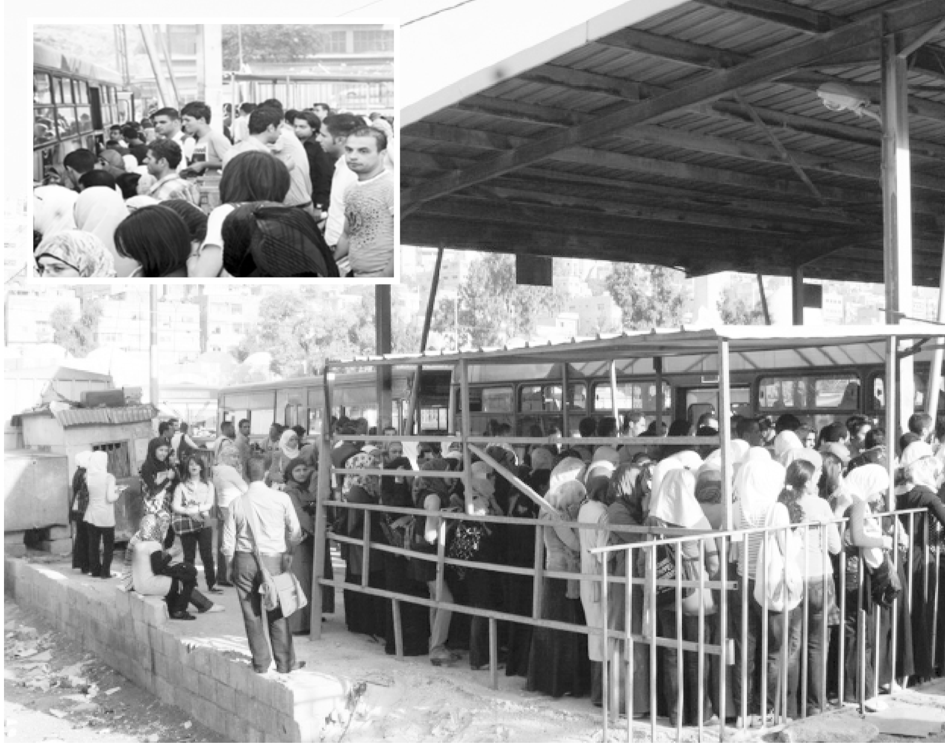
تزام الطلبة في مواقف باصات الجامعة الهاشمية..

ونظم وصيانة وتطبيقات برمجية وبالتعاون مع مختلف الدوائر والوحدات في الجامعة أنجزت هذا المختبر المتطور إضافة إلى ضمانها توفير الدعم التقني والفني المستمر له. وأضاف أن كوارس المركز وبالشراكة مع مختلف دوائر الجامعة عملت على مواجهة الزيادة في أعداد الطلبة بافتتاح مختبرات حاسوب وانترنت متعددة في مختلف الكليات والمعاهد في الجامعة وحرصت على توفير كافة احتياجات الطلبة من أجهزة ومستلزمات وشبكات اتصال سلكية ولا سلكية تغطي مختلف مرافق الحرم الجامعي. وأضاف الدكتور اطرادات أن المركز عمل على تحديث منظومة البرامج الإلكترونية في الجامعة حيث استحدثت عددا هائلا من الانظمة الأكاديمية والإدارية وعدل ما يزيد على (١٤٠٠) برنامجا خلال الفترة القليلة الماضية بما يتواءم مع متطلبات الفصل الصيفي الثاني الجديد الذي باشرت الجامعة بتطبيقه اعتبارا من هذا العام. مؤكداً أن هذه البرامج تم تطبيقها للتأكد من عملها بصورة سليمة.