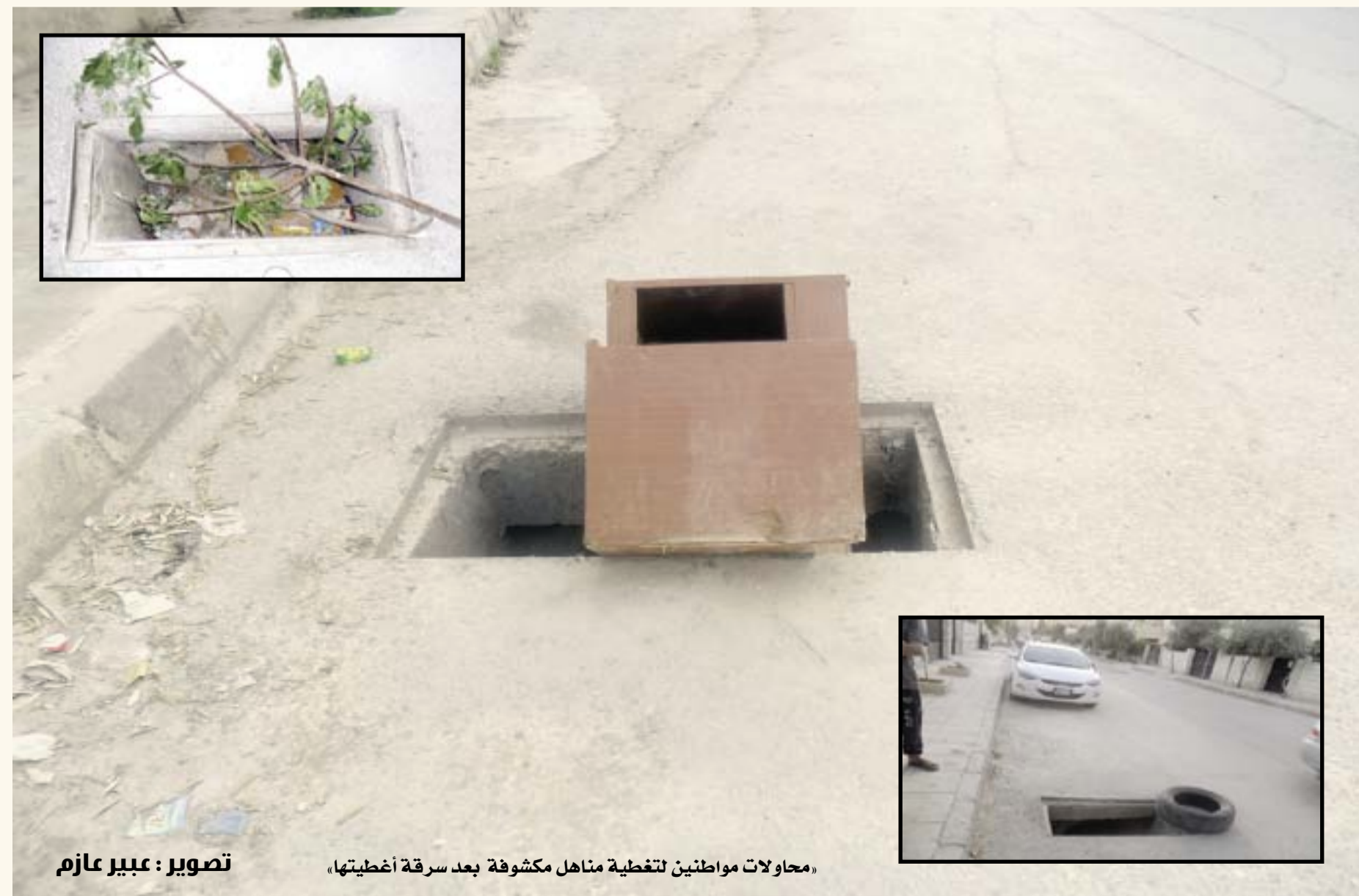
محاولات مواطنين لتغطية مناهل مكشوفة بعد سرقة اغطيتها،