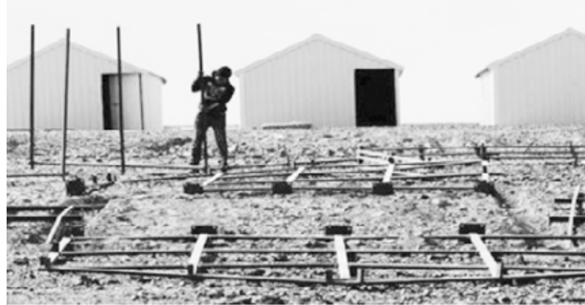
مخيم الأزرق يثير مخاوف أهالي من تكرار تجربة المفرق والرمثا ؛

وهذا الأمر خطوة في الطريق الصحيح لتنتقل من الزرقاء الى مختلف محافظات المملكة وخاصة في الأطراف ، ربما نستطيع بذلك قطع سلسلة التهميش التي ابتلى فيها الأردن على جميع المستويات.