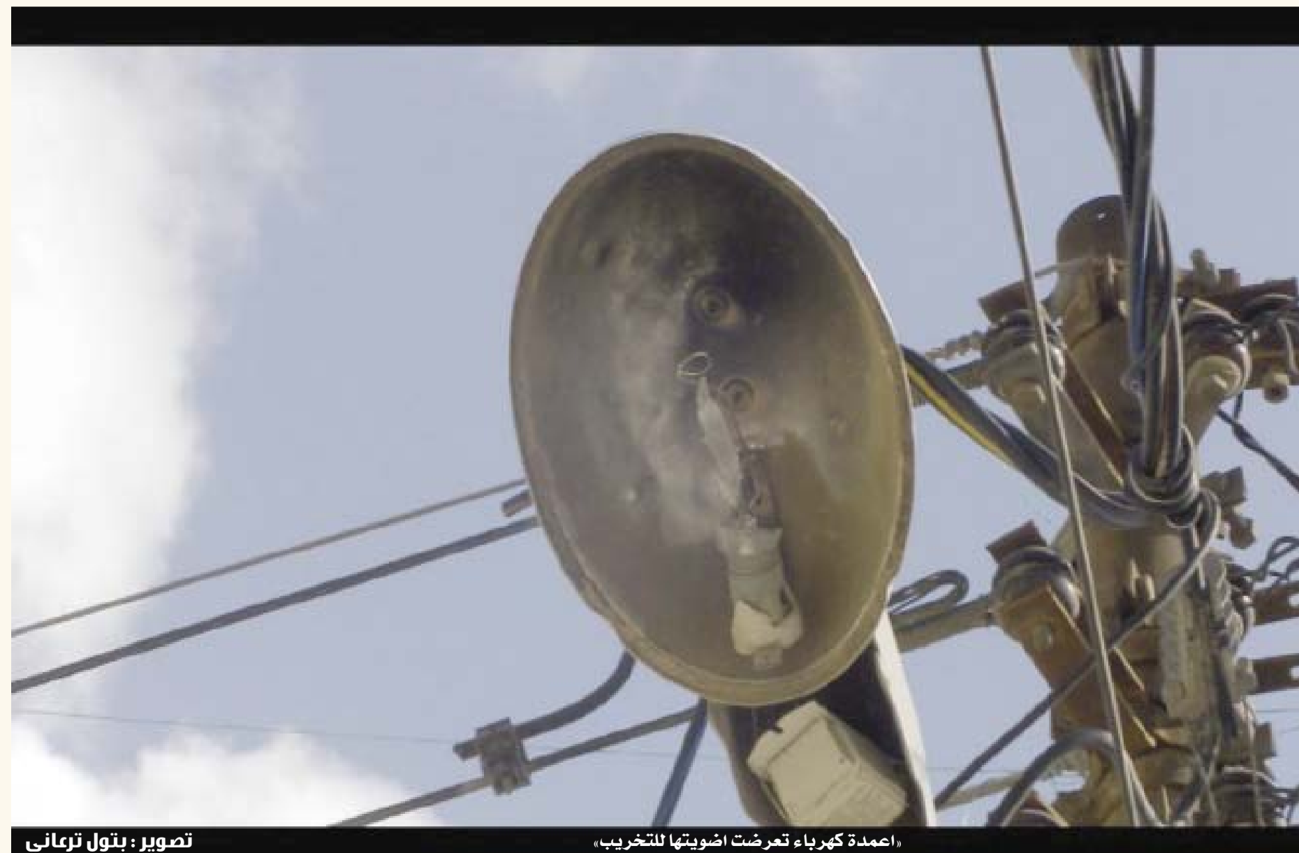
«عمدة كهرباء تعرضت لضوئها للتخريب»

وقال ان البلدية تعمل الان وفق برنامج يشتمل على اصلاح وتركيب خمس مصابيح اسبوعيا في جناعة، وتعهد بمواصلة السعي من اجل حل مشكلة الانارة في الحي.