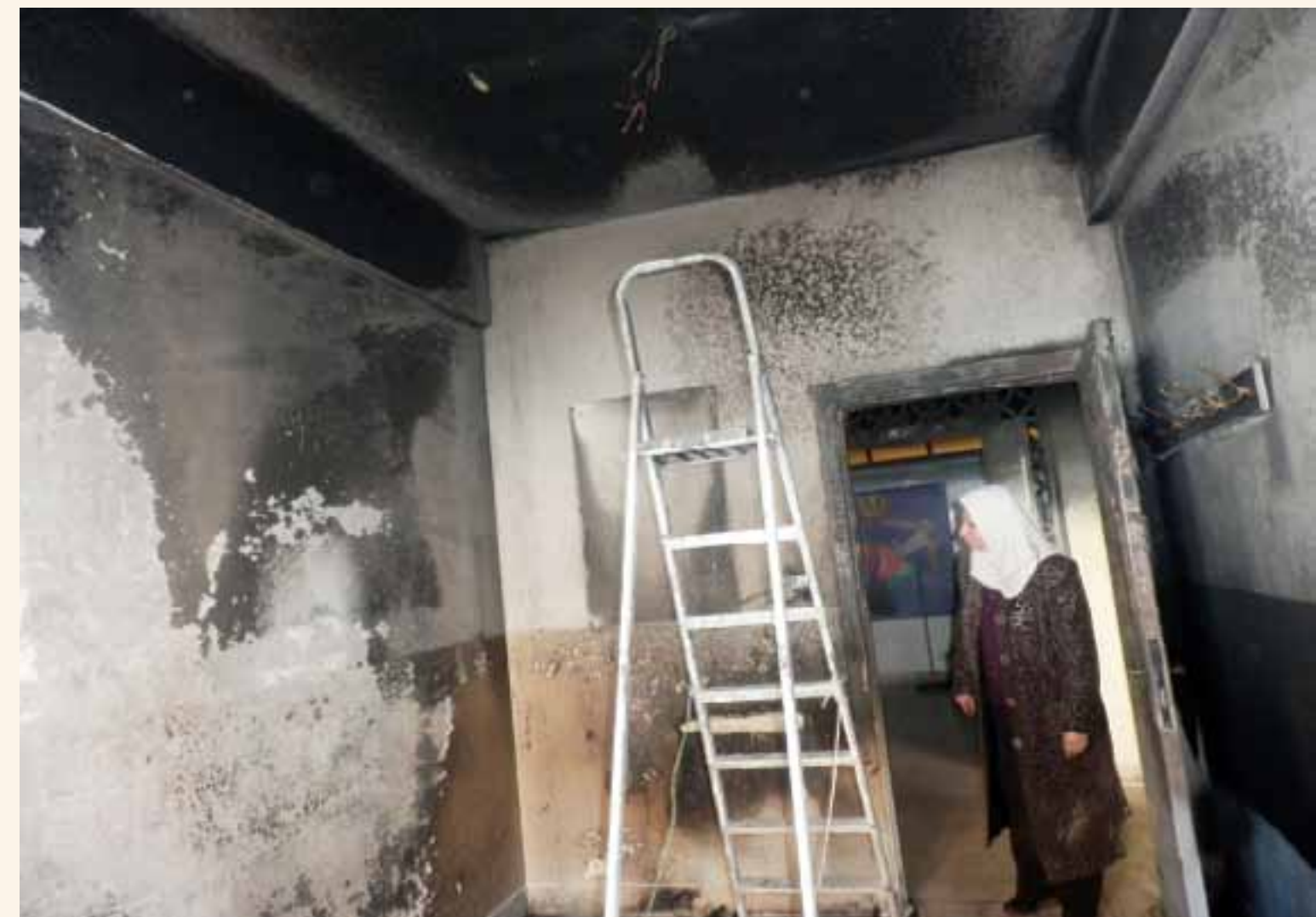
غرفة مساعدة المديرية والتي حدث بها التماس الكهربائي