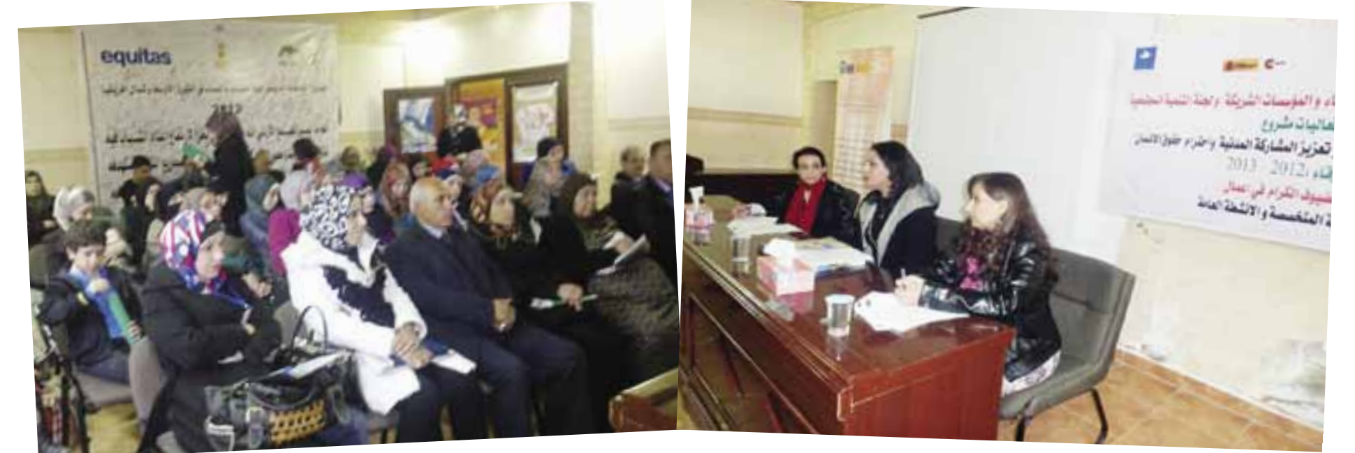
تصوير: فضاة العبوشي